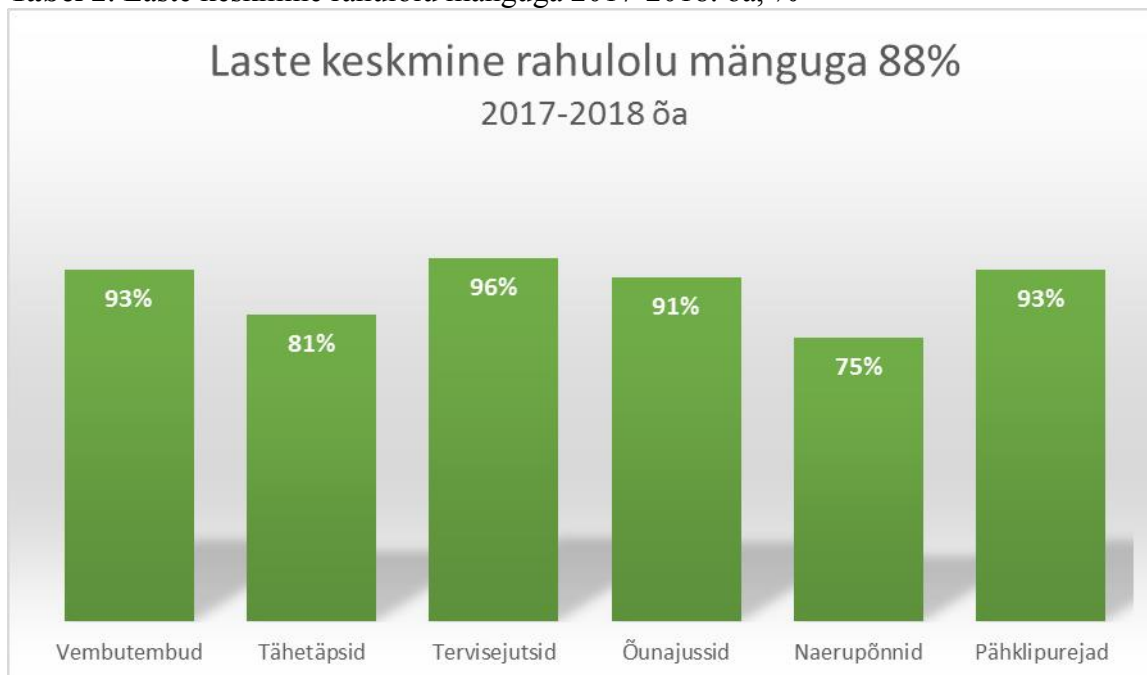
Tabel 2. Laste keskmine rahulolu mänguga 2017-2018. õa, %

Õppe- ja kasvatustöö projekt „Õnneseene Vabariik!“ õnnestus väga hästi.